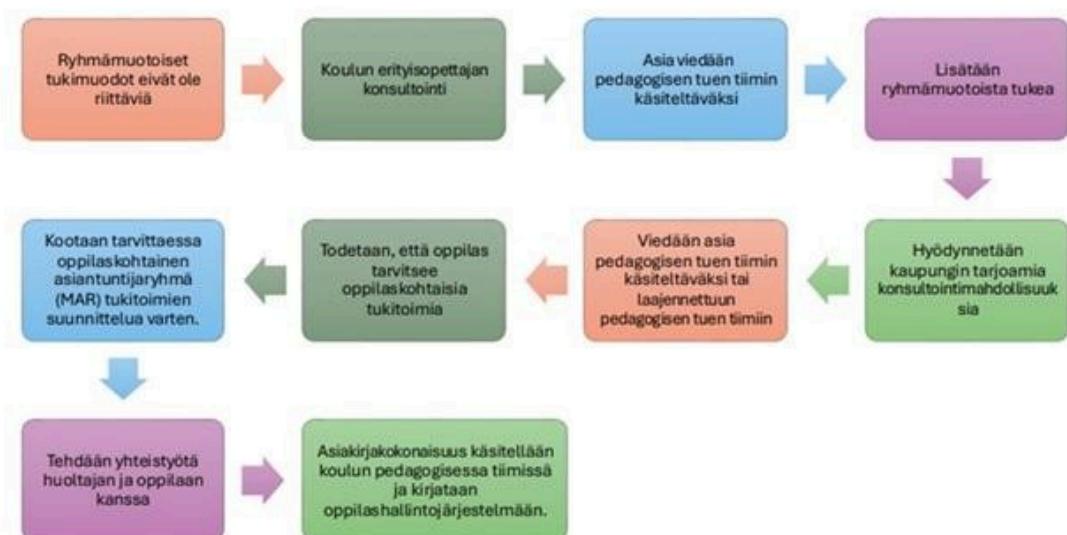
Kuva 1. Ryhmäkohtaisista tukimuodoista oppilaskohtaisiin tukitoimiin siirtyminen.